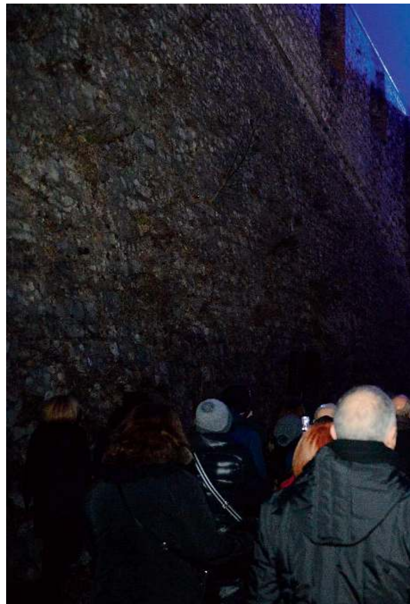
Torre dei Francesi. «Ecce homo» in onore di Moretto e della Pinacoteca

Il festival è raggiungibile a piedi, salendo sul Cidneo lungo il percorso illuminato da piazza Tito Speri, oppure con i bus navetta previsti da via San Faustino e da piazzale Arnaldo (partenze ogni 10 minuti tra le 17.30 e l'una di notte). Ci sarà anche un trenino gratuito da piazza Paolo VI (ogni mezz'ora dalle 17 alle 22). //