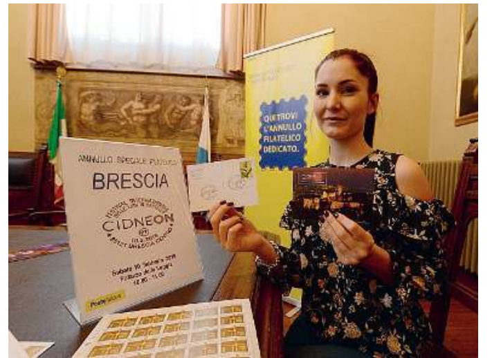
Annullo filatelico. Presentato ieri in Loggia