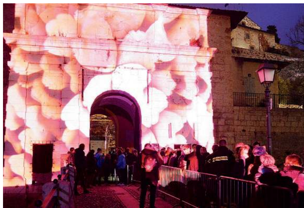
In coda. Subito tutti pazzi per CidneOn: oltre 26mila visitatori nella giornata inaugurale

L'inaugurazione La «prima» del Festival internazionale delle luci ha attirato visitatori da tutto il Paese. Code contenute con la «chiave magica», prenotata da quattromila a sera