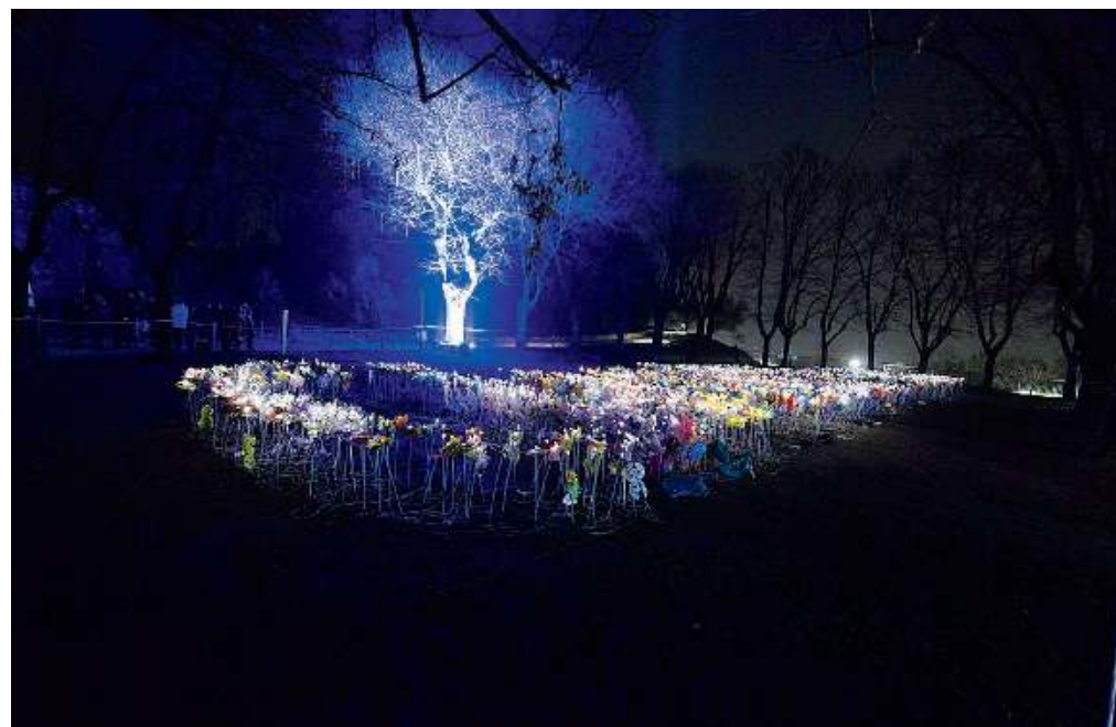
Bastione San Marco. Le farfalle realizzate da 2.500 bimbi e ragazzi delle scuole bresciane

«Non avevo mai visto il castello sotto questa luce», afferma una giovane donna bresciana, il volto illuminato dallo stupore. Come i volti di coloro che, percorrendo le vie della città, in queste sere fino a sabato prossimo vedranno le mura e le torri del Castello illuminate di bianco e di blu, i colori della nostra bandiera. // ADM