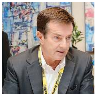
Gori. Ieri al Giornale di Brescia

Per il candidato del centrosinistra la chiave sarà lo sviluppo inclusivo