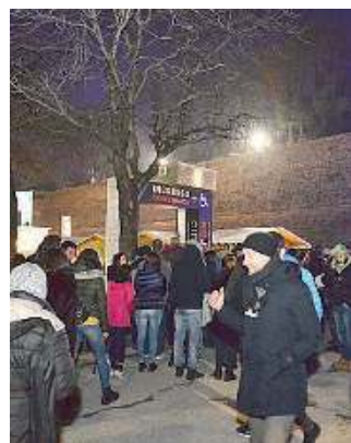
Inizio. Chiave magica all'ingresso

■ La «chiave magica» per saltare le code ha fatto registrare il tutto esaurito sia nella serata di apertura, sia per stasera. Alcuni slot esauriti anche domani, mentre durante la settimana ci sono ancora spazi liberi. Ogni chiave costa 8 euro, non è nominale e se ne possono acquistare al massimo 20 (per i gruppi oltre venti persone sono previsti sconti). Per i bam-