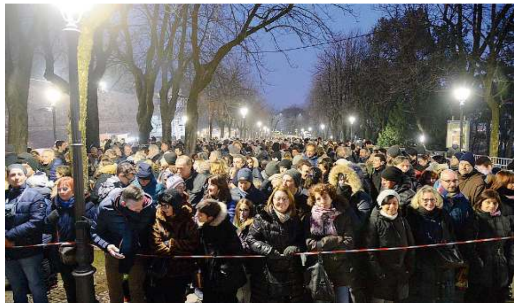
Folla. Oltre ventiseimila persone per la prima del Festival delle Luci