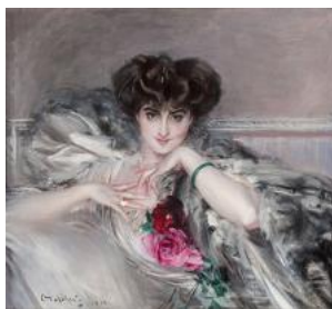
100 STRAORDINARI CAPOLAVORI ITALIANI: DA HAYEZ A BOLDINI