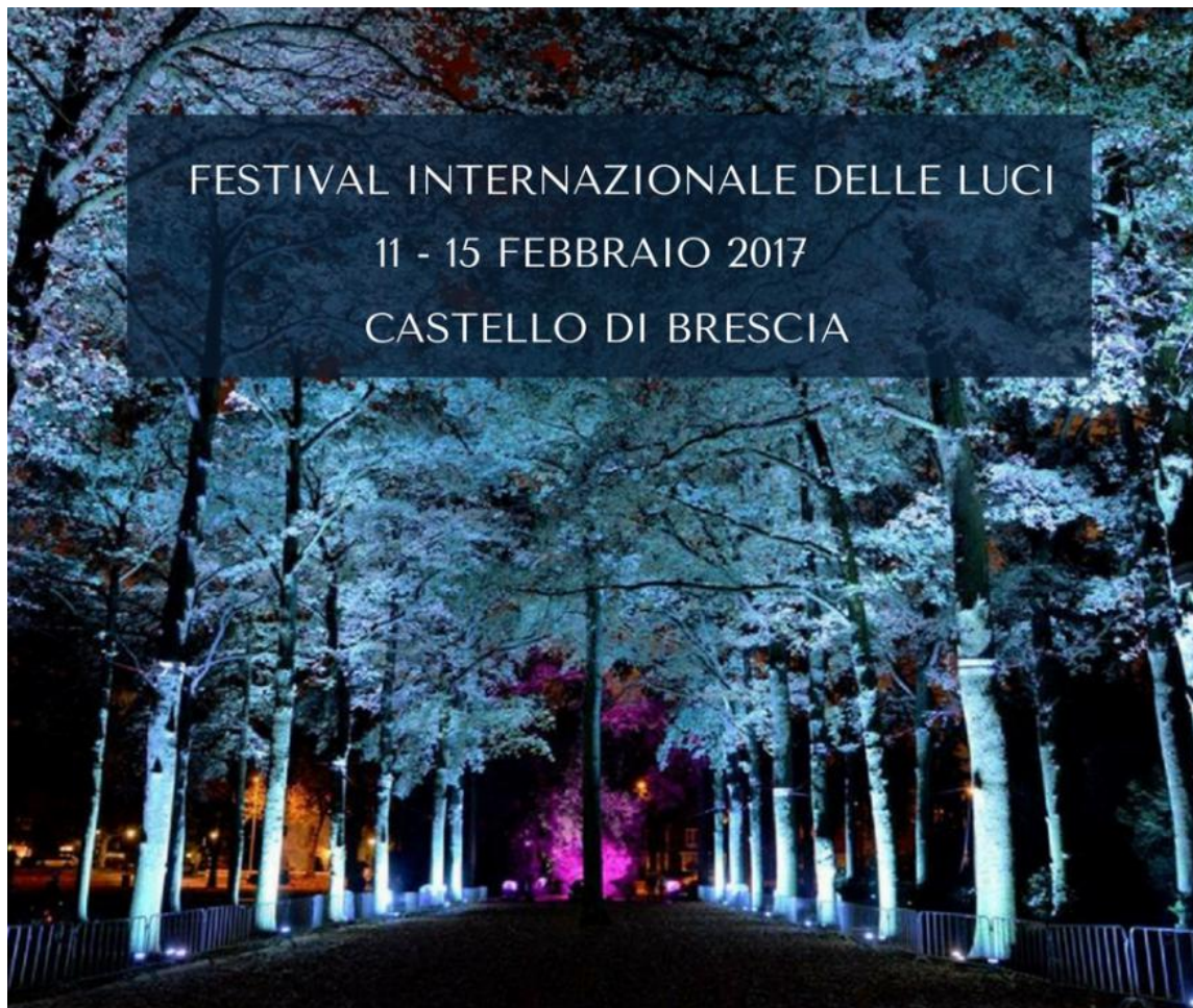
Brescia, il Festival delle Luci Cidneon

Dall'11 al 15 febbraio 2017, sarà realizzato un festival delle luci, con installazioni, videoproiezioni e performance live, che trasformerà gli ambienti del Castello in un percorso animato dentro la storia della città, dalle origini celtiche a oggi: Il Festival Internazionale delle Luci.