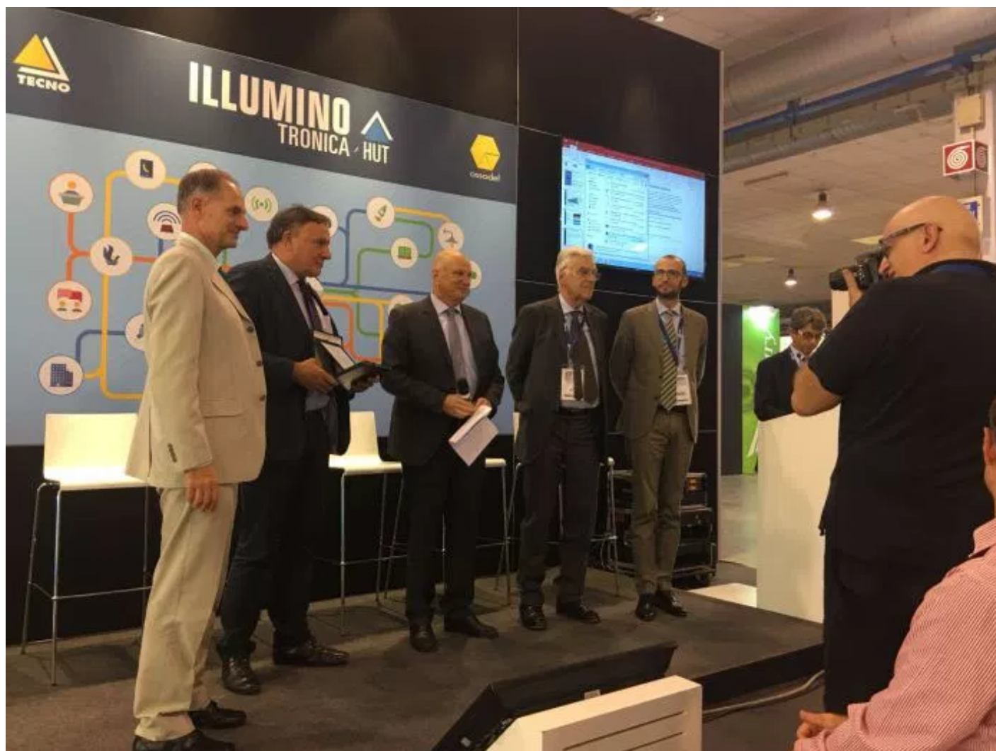
Il festival delle luci di Brescia è stato premiato