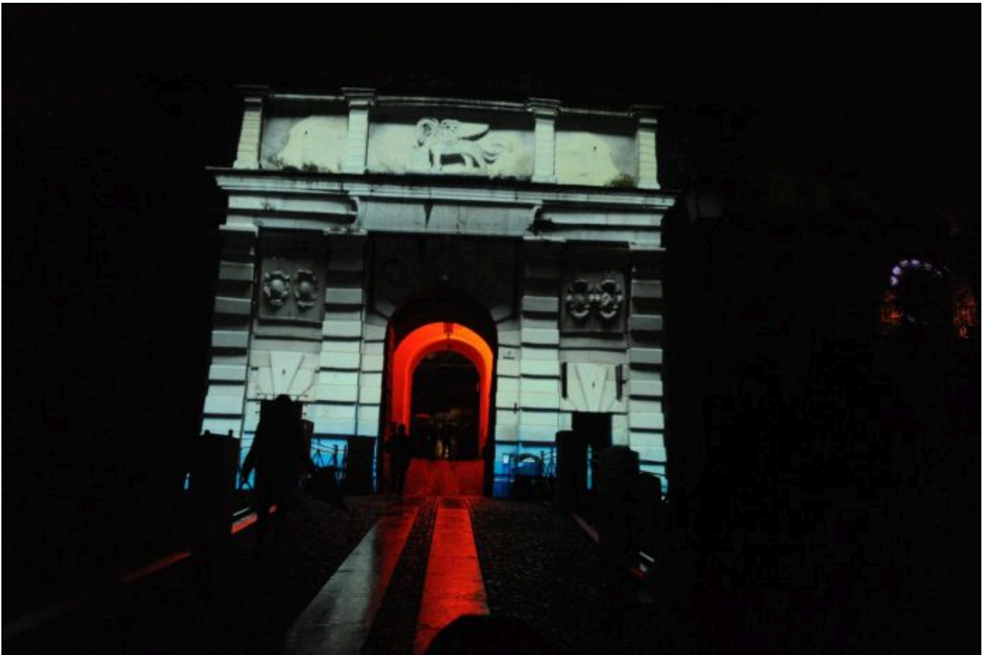
L'edizione 2017 del Festival delle luci CidneOn.

Il Festival, promosso nel febbraio 2017 dal Comitato Amici del Cidneo – attivo dal 2015 per la valorizzazione del Castello – con la direzione artistica di Cieli Vibranti e la