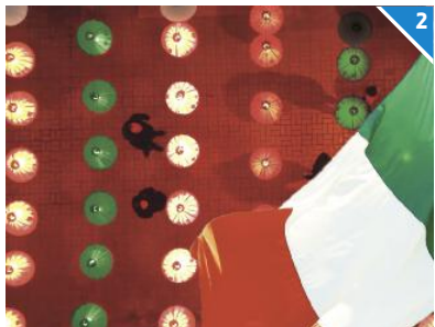
TRICOLORE: 19esima installazione «Tricolore» sul sentiero bastione San Marco, a cura delle scuole bresciane. Lanterne luminose con disegni di icone italiane per essere poi illuminate con i colori della bandiera