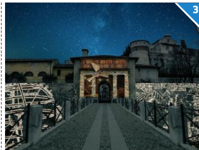
TUNNEL BLU: ottava installazione «Viaggiatori nel tempo» nel tunnel torre coltrina, realizzata da Daniel Kuriczak. Un viaggio nella preistoria grazie a un sistema di proiezioni luminose delle incisioni rupestri camune

L'EVENTO. La manifestazione che aprirà i battenti il prossimo 8 febbraio è stata presentata al Palazzo della Regione. Nelle prime due edizioni 500mila visitatori