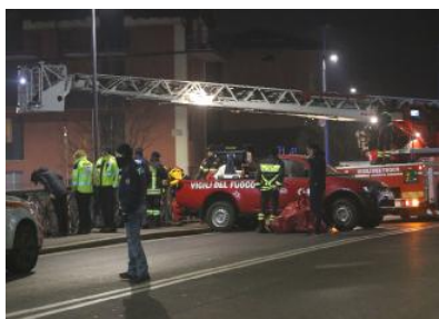
L'autoscala dei Vigili del fuoco intervenuta sul ponte

È ancora avvolto dal mistero il ritrovamento di un cadavere nel greto del fiume Mella all'altezza del ponte all'innesto tra via Milano e via Valcamonica avvenuto alle 22.30 di ieri. L'ipotesi più plausibile è quella di un gesto estremo, ma non viene escluso che la persona sia stata volontariamente spinta in acqua. Il volo da circa sei metri di altezza contro il basamento di