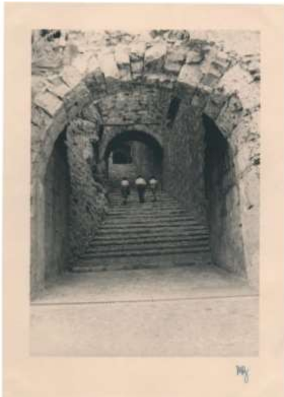
Foto strada del soccorso

- Ottenere un premio di 30.000 euro che sarà destinato a un progetto volto a valorizzare la strada del soccorso attraverso una illuminazione affascinante. La strada del soccorso è un percorso "magico" sia dal punto di vista paesaggistico sia storico ma che purtroppo è sempre stato un sentiero sconosciuto ai più.