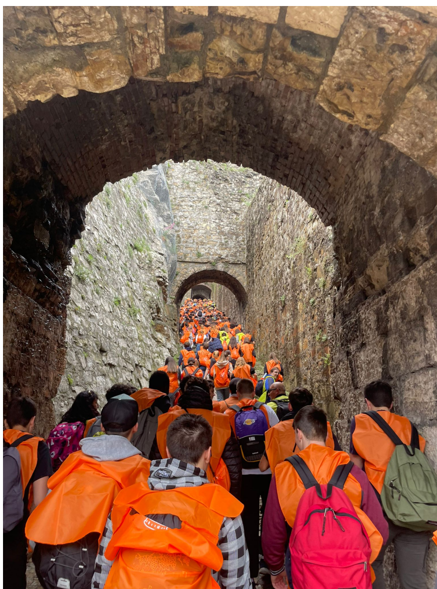
Trofeo del Sostegno – 1° edizione 11 maggio 2023 Comitato Amici del Cidneo - Gruppo lavoro Percorsi sportivi nell'immagine la Strada del Soccorso