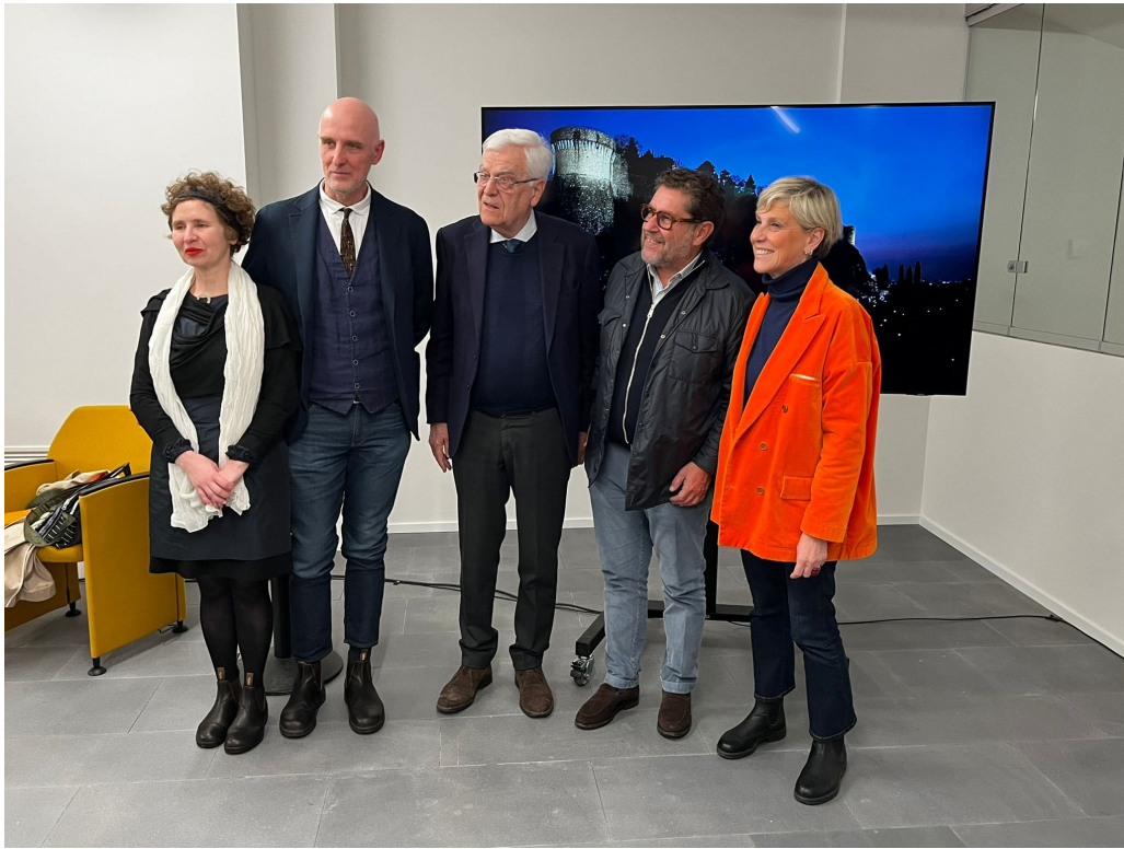
La presentazione dell'opera _FONDAMENTA DEL FUTURO_ in data 13 aprile 2023.

L'opera, promossa dal Comitato Amici del Cidneo, resterà esposta presso il Vigneto Pusterla fino a novembre 2023.