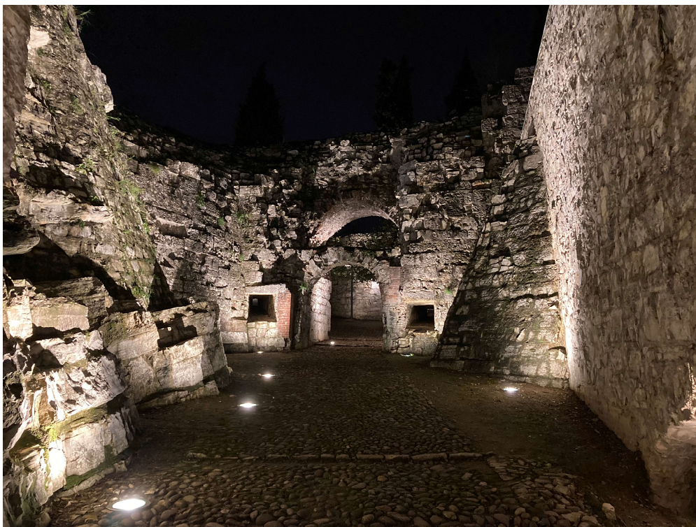
La Strada del Soccorso nel Castello di Brescia.